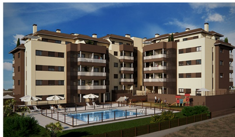
Vive Navalcarnero Navalcarnero. Próximo inicio obra 40 pisos, áticos y bajos con jardín Calidades Porcelanosa