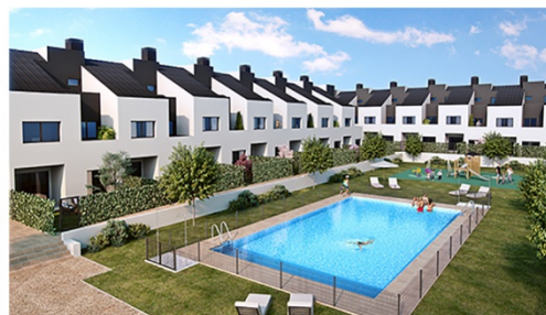
Vive Cañaveral El Cañaveral Próximo inicio obra 43 unifamiliares con zonas comunes Amplitud y excelentes calidades