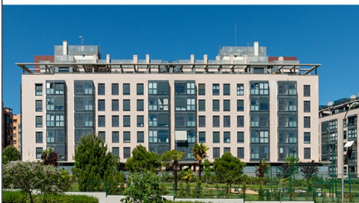
Vive Sanchinarro Sanchinarro. Viviendas ya terminadas 69 pisos con amplias zonas comunes.