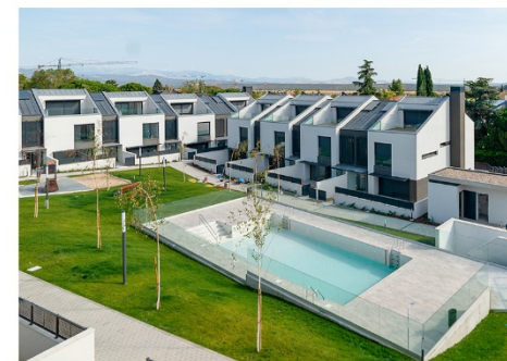
Las Rozas Premium Las Rozas. Viviendas entregadas 20 chalets con calificación energética A