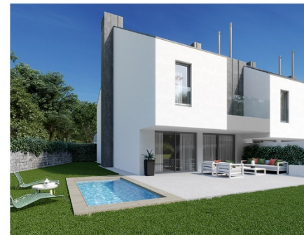
Viveme La Gardenia Torrelodones Torrelodones. Obra en curso 14 chalets con jardín privado Calificación energética A