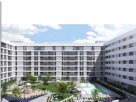
Vive Parque Ingenieros Ciudad de los Ángeles. Próximo inicio obra 194 viviendas protegidas Calificación energética A